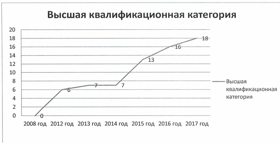
Диаграмма по всем квалификационным категориям (в динамике)